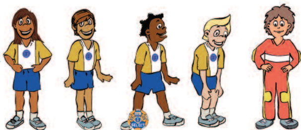
4 joueurs et un gardien de but